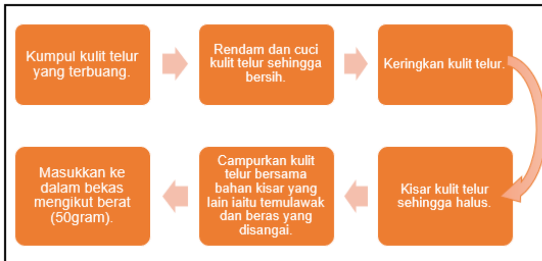
Rajah 2. Prosedur menghasilkan Shell Secret Hut

Peringkat ini merupakan satu tahap yang sangat penting di mana kita dapat mengetahui sama ada idea kita dapat menyelesaikan masalah pengguna yang ditemui semasa peringkat empati. Sampel produk ini telah diserahkan kepada Makmal KBioCorp di Kulim Hi Tech Park. Hasilnya, produk ini selamat untuk digunakan kerana ia tidak mengandungi merkuri, bahan kimia dan plumbum. Beberapa responden juga memberikan respon positif setelah mencuba sampel produk.