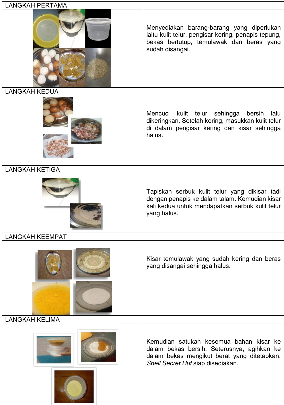
Rajah 3. Proses Penghasilan Shell Secret Hut